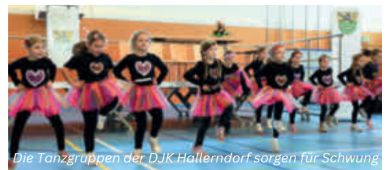
Die Tanzgruppen der DJK Hallerndorf sorgen für Schwung