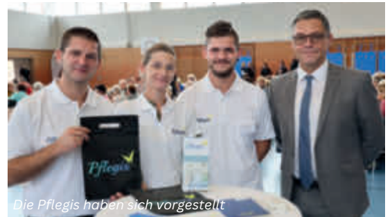
Die Pflégis haben sich vorgestellt